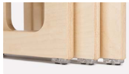
Jaloissa ruuvikiinnitteiset huopanasat vakiona.